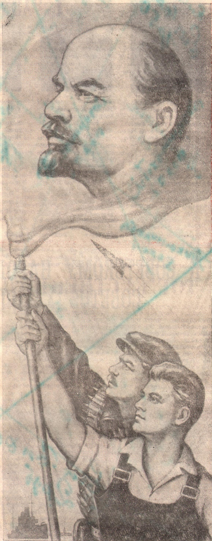
Рисунок художника А. Кручины.